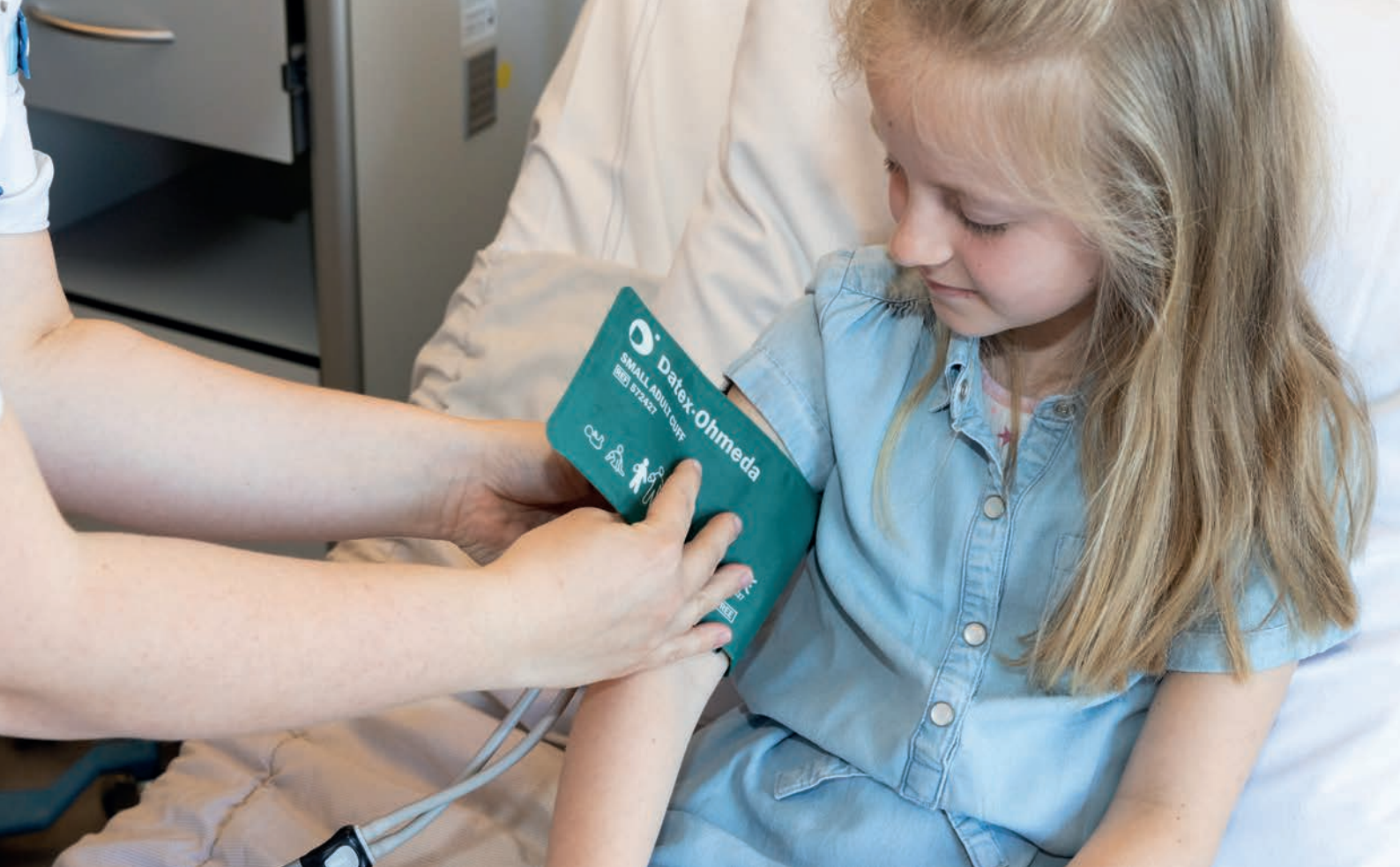
De verpleegkundige meet je bloeddruk.