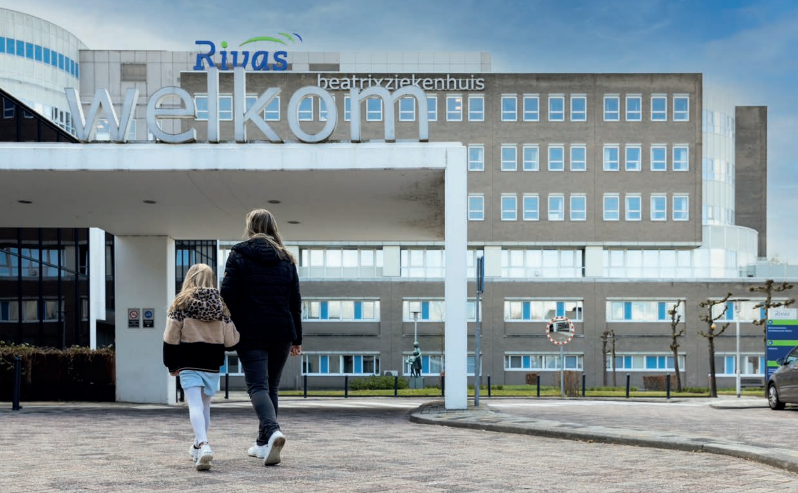
Dit is de ingang van het Beatrixziekenhuis.