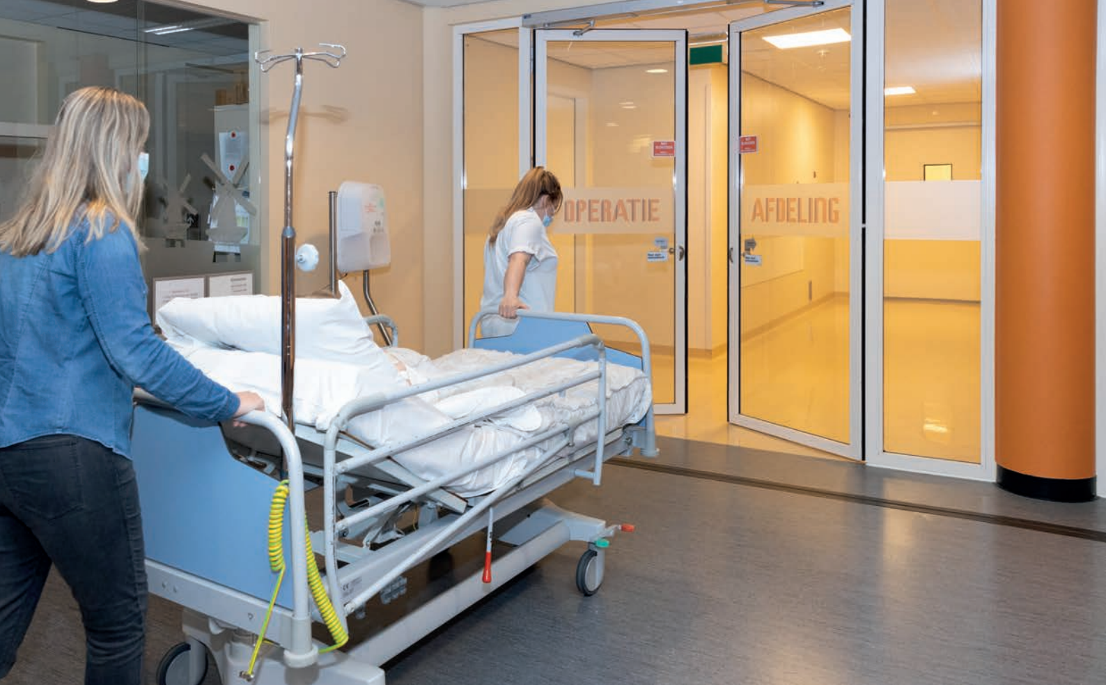
Dit is de ingang van de operatieafdeling.