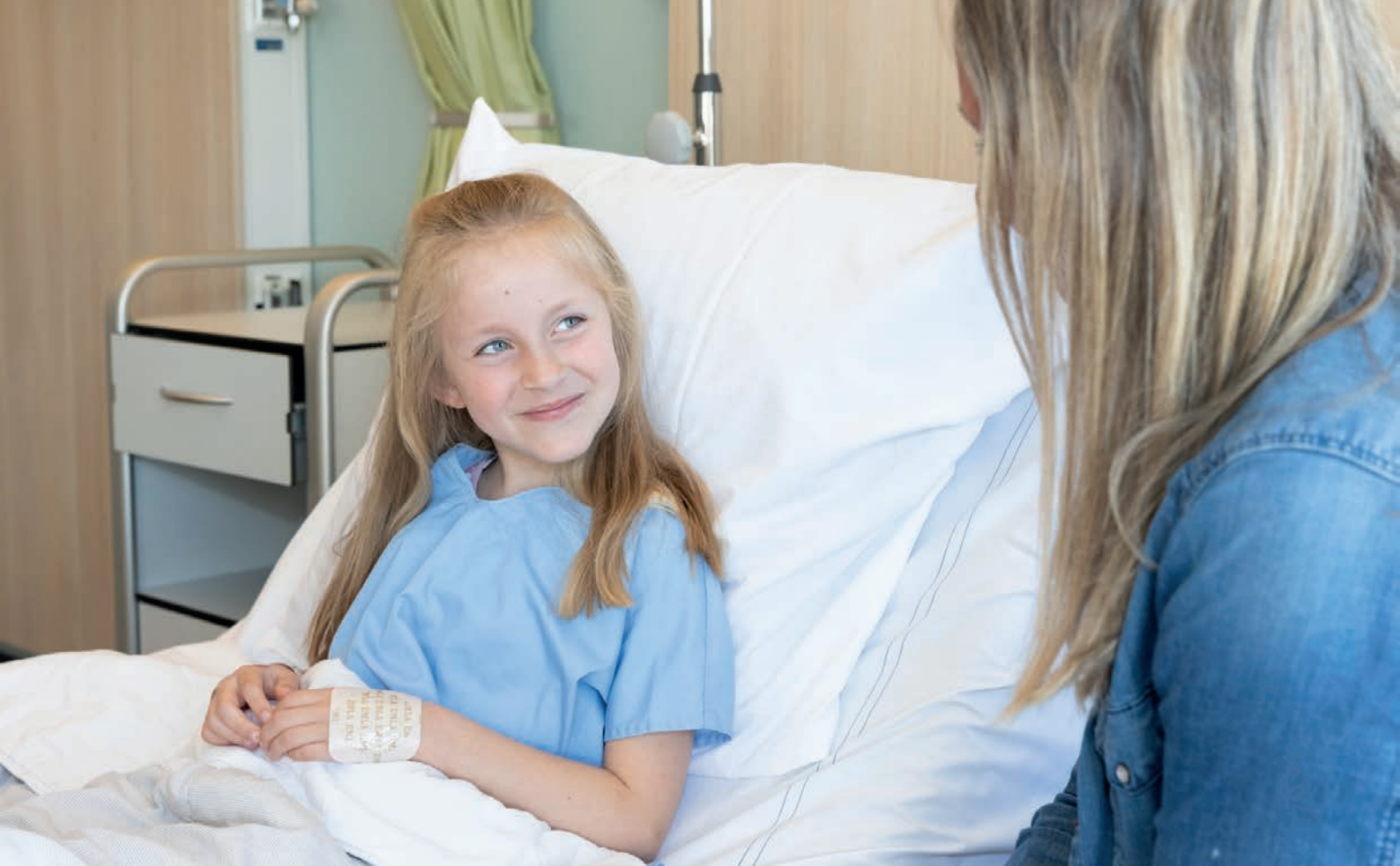
Dagopname Kinder- en Jeugdafdeling